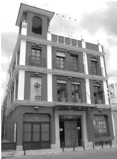
C/. La Fuente, 26