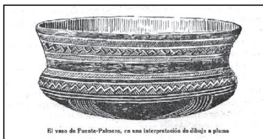
El vaso de Fuente-Palmera, en una interpretación de dibujo a pluma